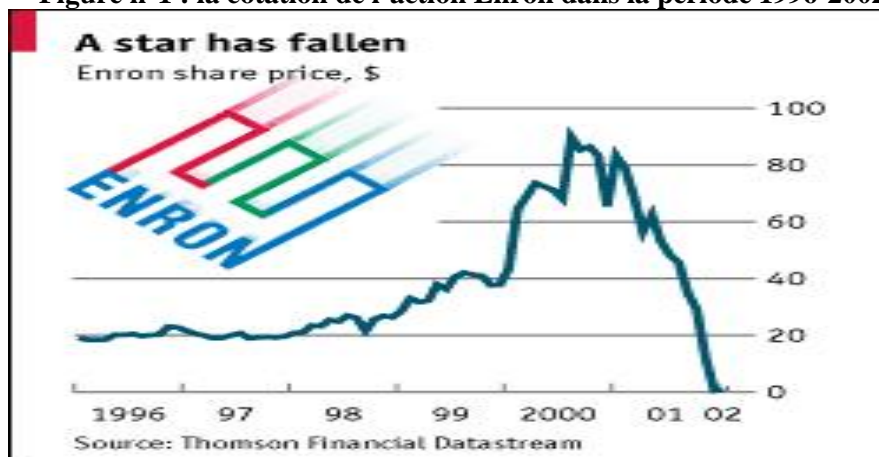
Figure n°1 : la cotation de l'action Enron dans la période 1996-2002